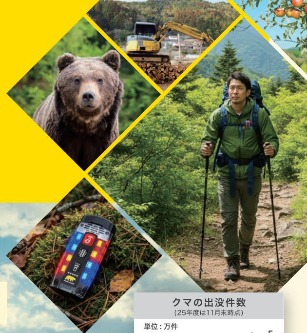
クマの出没件数 (25年度は11月末時点)

クマ被害を防ぐための最大の対策は、そもそも遭遇しないこと。 ベアーガードは、クマの習性を利用した“次世代の装着型アラートデバイス”です。